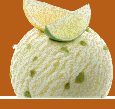
lemon & lime

Caramel Crème-glace mit Rahmcaramelstückchen